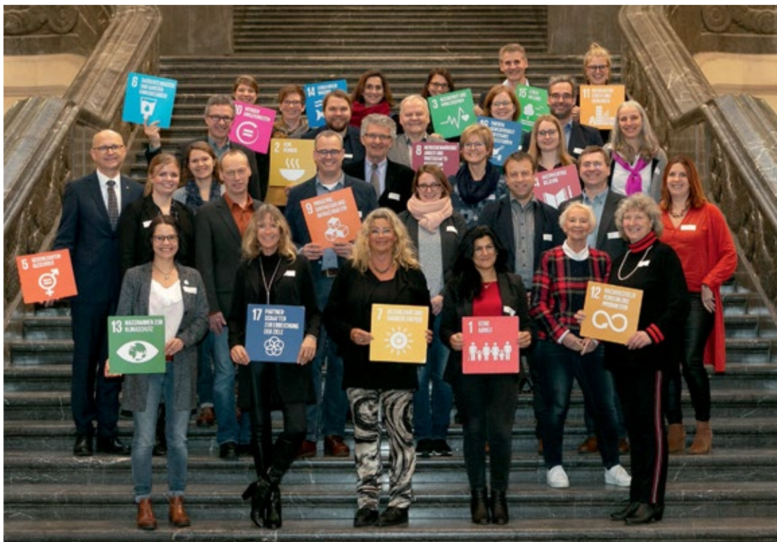
GNKN Netzwerktreffen, Dezember 2019.

Der Landkreis Lüneburg und die Hansestadt als beteiligte Akteure am Projekt Global Nachhaltige Kommune in Niedersachsen werden gemeinsam die im zurückliegenden Zeitraum entwickelte Zusammenarbeit verstetigen und in künftigen Projekten fortführen. Dabei wird der interkommunale Austausch im Netzwerk der GNKN von hohem fachlichem Nutzen sein.