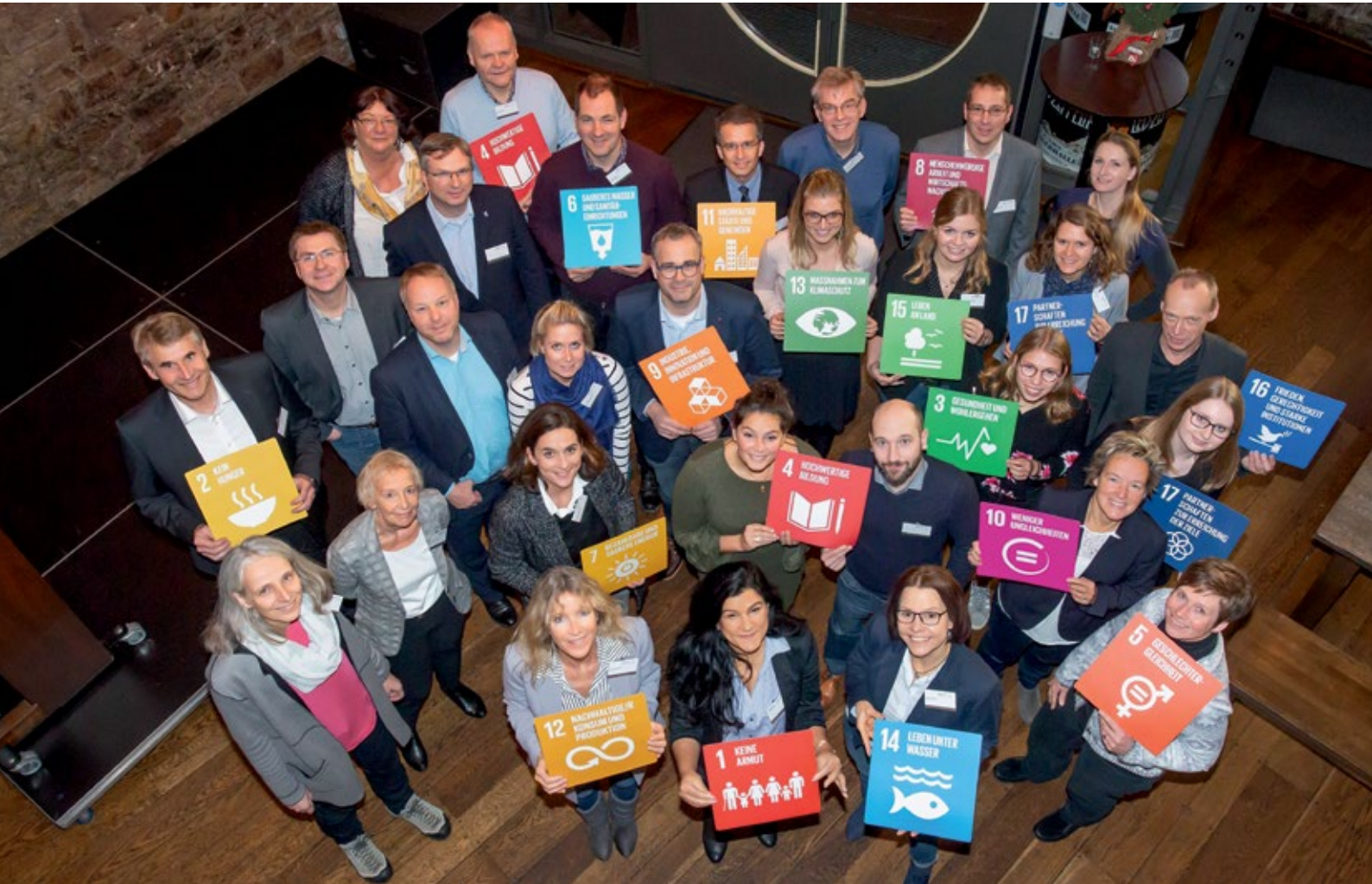
Das erste Vernetzungstreffen mit den Kommunen in Osnabrück