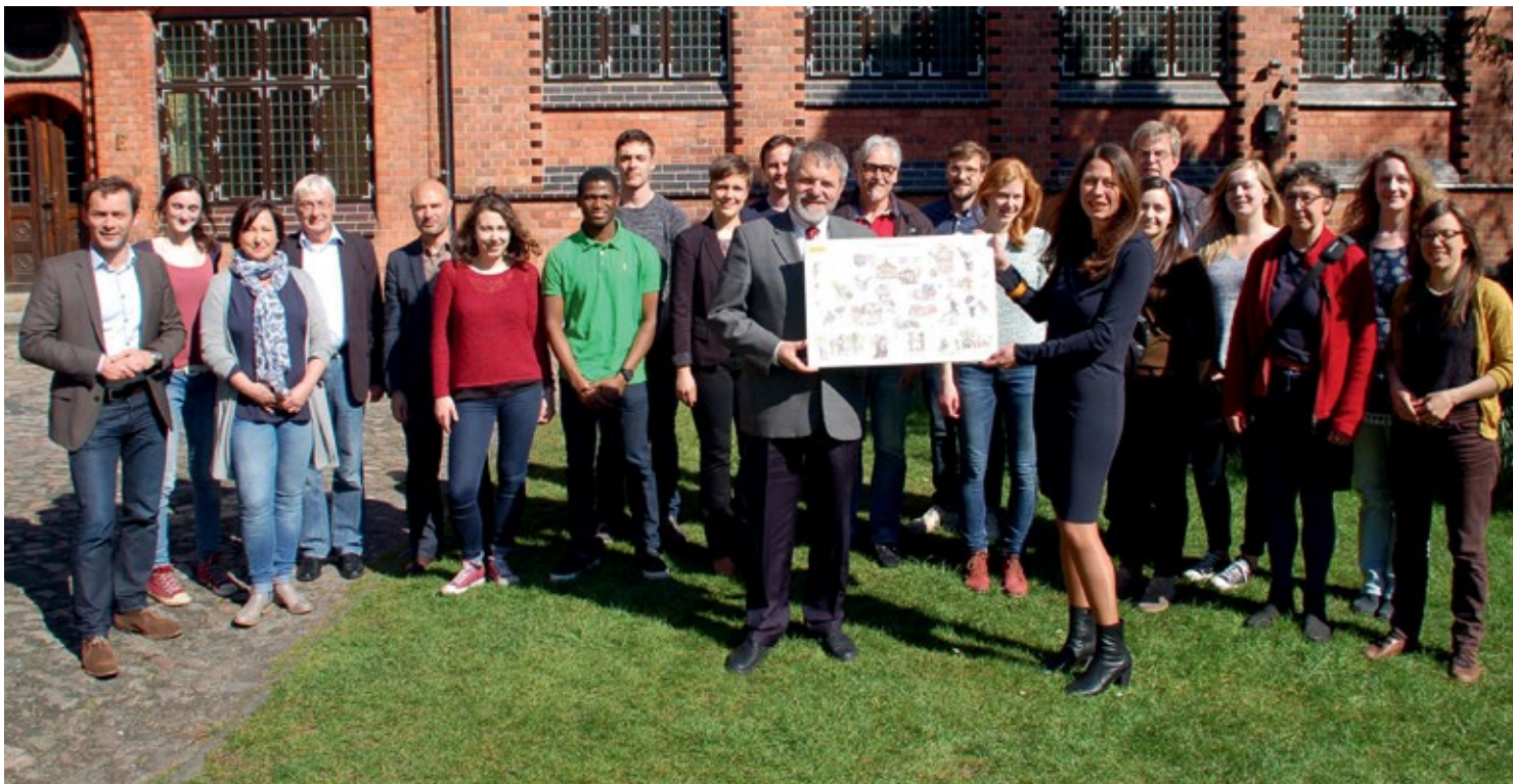
Übergabe des „Atlas der Visionen“ an Oberbürgermeister Ulrich Mädge durch Prof. Ulli Vilsmaier

Die KSL veröffentlicht jährlich einen Bericht über die Klimaschutzaktivitäten und zum Stand der Energiewende im Landkreis.