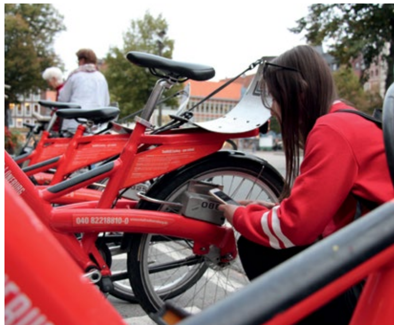
StadtRad Lüneburg

Zur Sensibilisierung macht die Hansestadt seit 2017 beim Projekt StadtRadeln mit und der Landkreis kürt monatlich den Umsteiger des Monats und führt mit AOK und ADFC die Kampagne „Mit dem Rad zur Arbeit“ durch. Zur Förderung des Radverkehrs werden lokale Verbände wie der ADFC und VCD in die Arbeit eingebunden und als Unterstützer für Aktionen gewonnen.