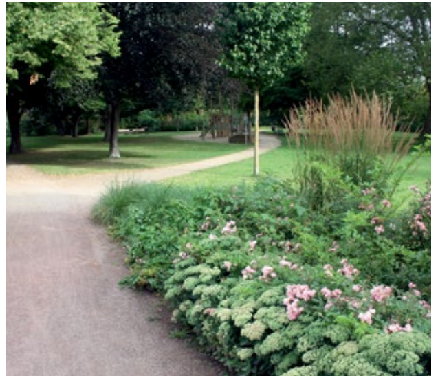
Grünband Innenstadt 2020.

und sichtbar zu machen, Fuß- und Radwege zu verbessern oder auch neu anzulegen, sowie die Grün- und Freiflächen besser miteinander zu verbinden. Ein Ziel der Hansestadt Lüneburg ist es, ein „Grünband Innenstadt“ entlang der Grünanlagen Kalkberg, Liebesgrund und Kreidebergsee sowie der Basteihalbinsel zwischen Ilmenau und Lösegraben zu entwickeln und insbesondere die Umgestaltung von Straßen, Wegen und Plätzen anzugehen.