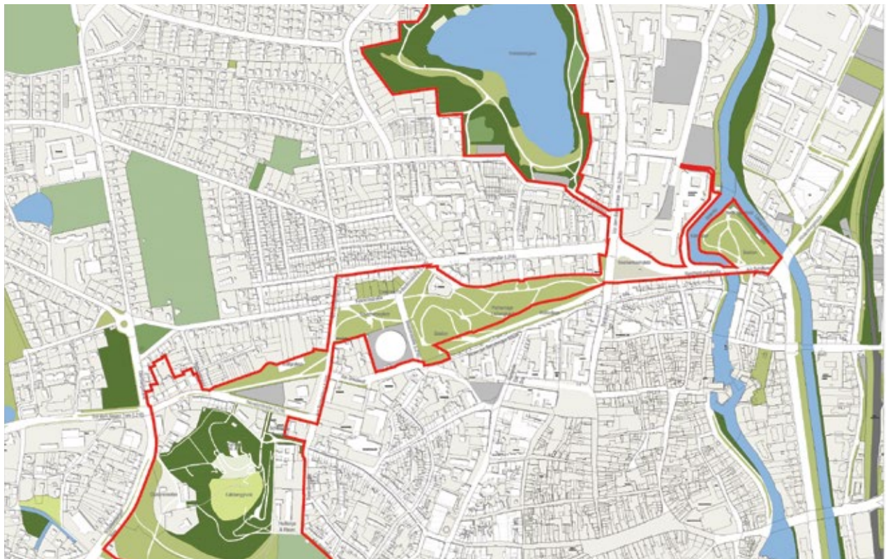
Rahmenplan Grünband Innenstadt. © Cappel + Kranzhoff