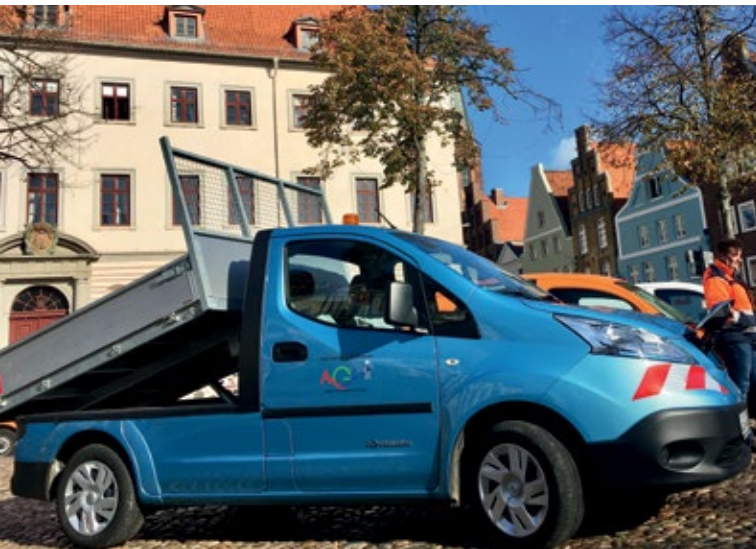
Elektro-Nutzfahrzeugen des AGL-Fuhrparks.

Kommunen und viele Unternehmen aus dem Einzelhandel sowie Privatpersonen setzen sich in Lüneburg und Umgebung für den fairen Handel ein (siehe Kapitel 3.2). In vielen Geschäften und in der Gastronomie wird der faire Handel beworben und eine wachsende Palette an Produkten angeboten.