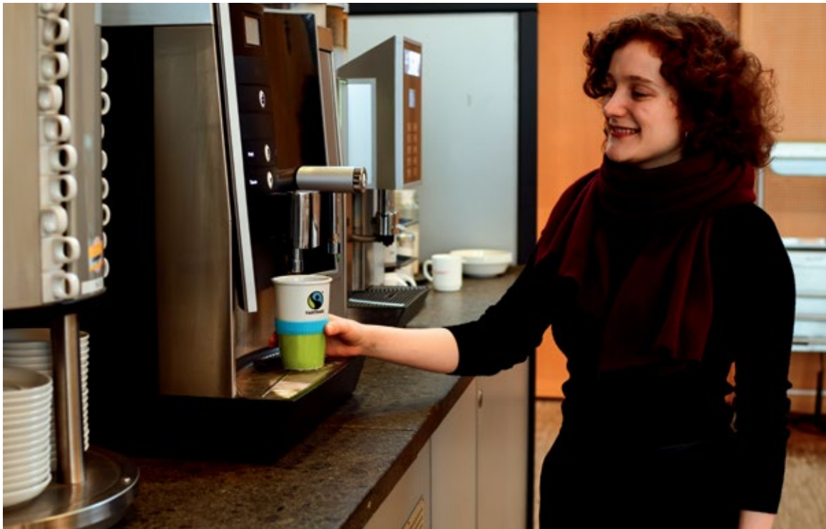
Studentin der Leuphana zapft Fairtrade-Kaffee in der Mensa