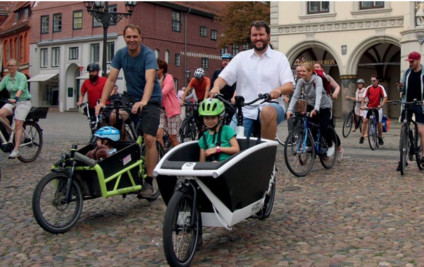
Auftakt zum Stadtradeln.